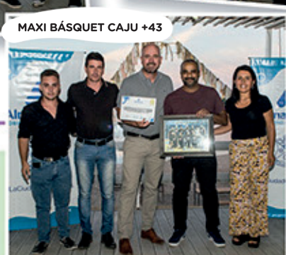
MAXI BÁSQUET CAJU +43